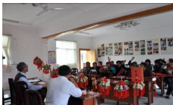
照片 6 讨论进一步的发展