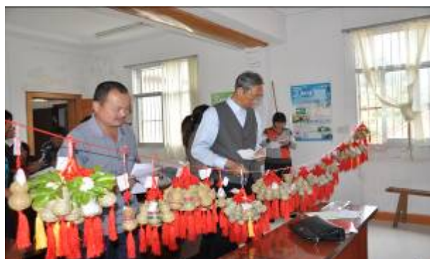
照片 3 认真评选