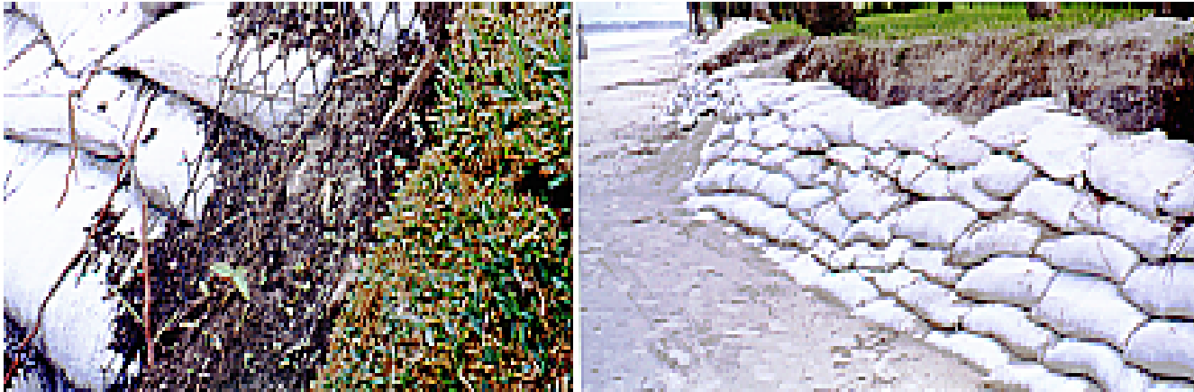
图 2 用沙袋抵御海潮侵蚀：最初的控制侵蚀措施

最初在 2008 年解决的方法是用酒椰叶纤维制的袋子构建防冲堤，里面装上水泥（12%）和土壤（88%）的混合物，土壤来自清理植被阶段。将土袋堆成金字塔状，蒙上土工网（由高密度的聚乙烯挤压成的塑料掩蔽物），尽量减少波浪冲击，将从新栽植被处冲入水中沙子沉积下来，从而形成一个增强了的“毯子”和均一的表面，达到稳定性（图 2）。