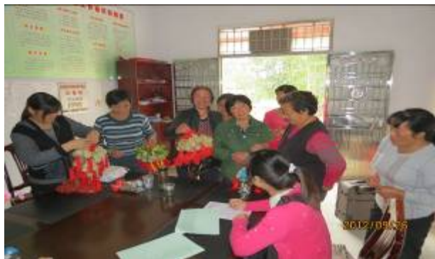
照片 1 学员们踊跃交来编织品参与评奖

在这次活动中，大家看到了在修建的 2 个水塘的灌溉下，农民正在收获丰收的水稻，看到了项目给农民带来了实实在在的效益。同时，也察看了农民对老茶园的更新改造的田块。但因修剪力度不够，担心影响来年收益，估计收效不大。老茶园更新改造可能成为项目区下一个主要内容，原则上坚持重剪、重肥，深度改造，争取获得长远效益。