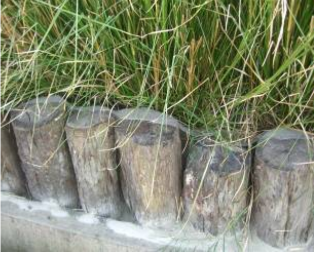
图5: 木栅栏, 土工布和香根草