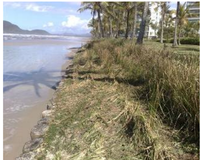
图8 强海潮袭击后的香根草篱, 未见土壤侵蚀