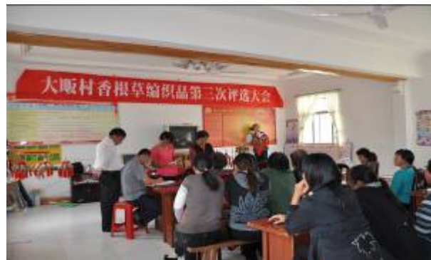
照片 2 评选现场