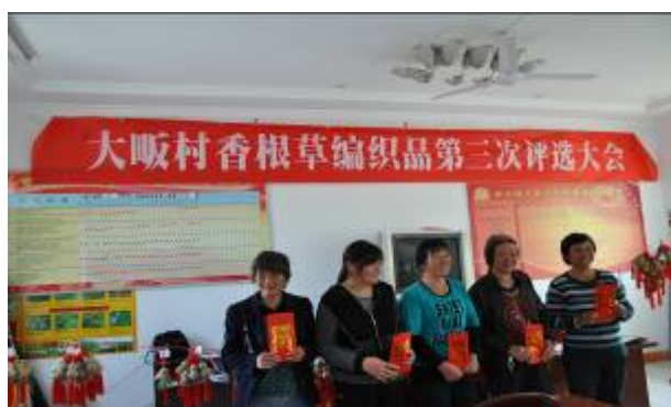
照片 5 三等奖获得者