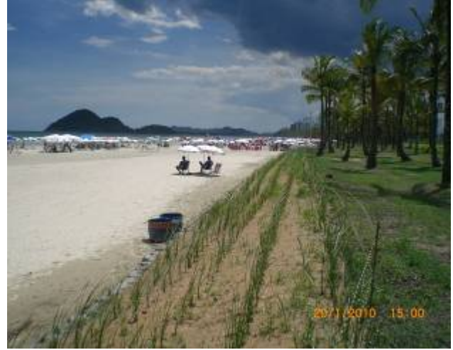
图6 刚刚开始生长的香根草