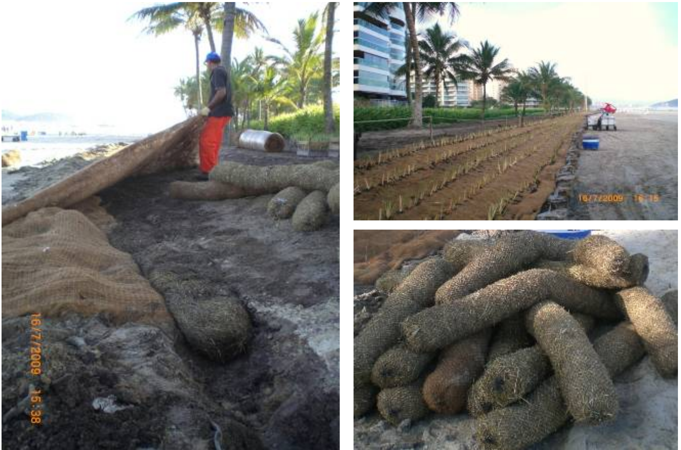
图4：安置了沉积物滞留器和椰子纤维侵蚀控制毯（左），最终的项目实施：木栅栏，侵蚀控制毯和香根草篱（右上），沉积物滞留器（右下）

考虑到在不久的将来海平面可能上升，设计者决定添加一些木栅栏将沙土与景观美化地区分隔开来，以增加结构的安全性。木栅栏采用了在都市化项目进展中存储的部分木头。斜坡也综合进了在项目进行中存储起来的生物质，根据巴西环境条例是不能烧掉这些东西的（图4）。