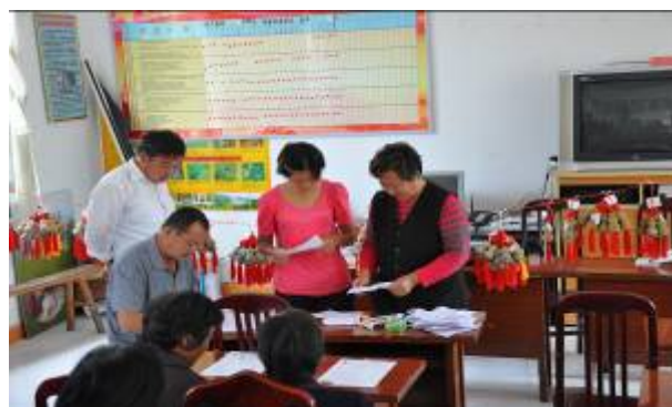
照片 4 仔细计票