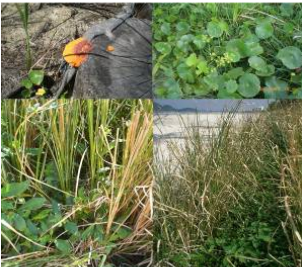
图7: 恢复质量指示: 真菌及一些军都乡土植物

现在, 在恢复项目首期实施两年后, 已经出现了草本乡土植物群落以及真菌, 它显示了该地区的恢复进程的质量以及土壤的生物多样性和稳定性 (图8)