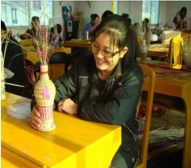
用香根草编织的花瓶及其编织者