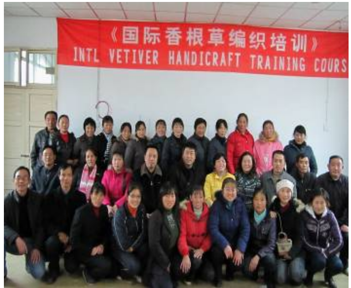
菖蒲镇领导和学员们合影

主办：中国科学院南京土壤研究所 中国香根草网络，南京市第 821 信箱，南京市北京东路 71 号 邮编：210008，电话：(025) 86881269，传真：(025) 86881000 E-mail: vetiver@jlonline.com 或 lyxu@issas.ac.cn Homepage: http://www.vetiver.org.cn