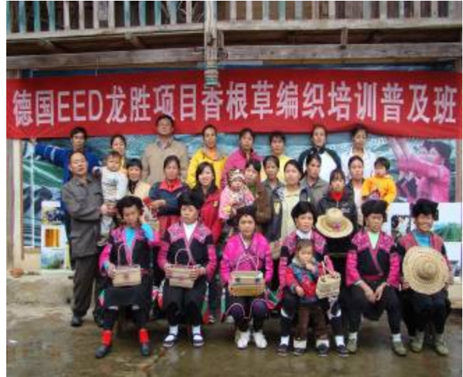
教员、工作人员、学员与其编织品合影