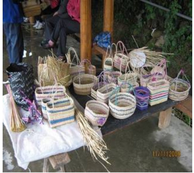
编织完工与正在编织的香根草工艺品