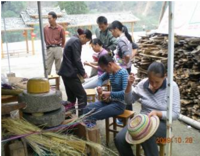
学员们全神贯注编织，互教互学