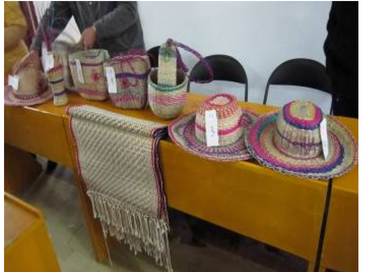
获奖的编织品：帽、蓆、篮、花瓶等