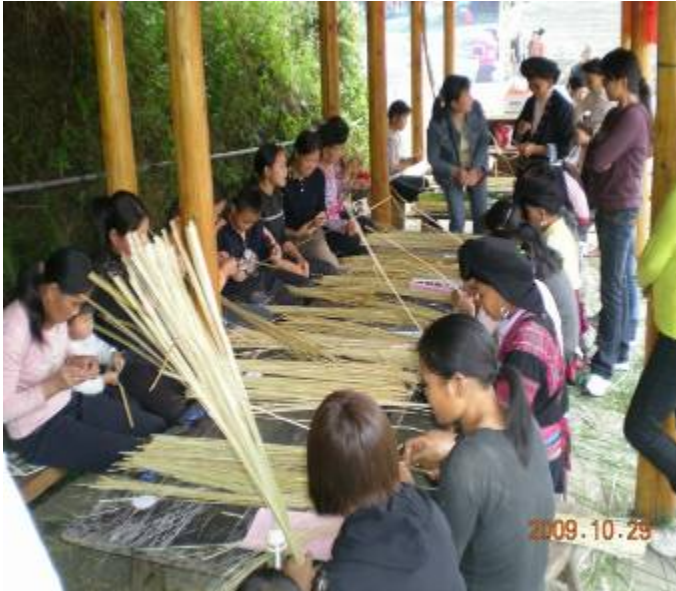
学员们选择处理香根草干草