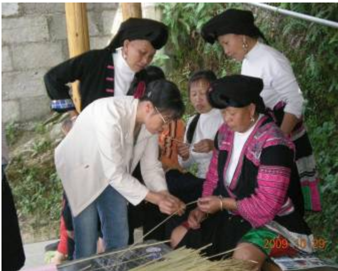
正在耐心地教少数民族学员进行香根草分草示范