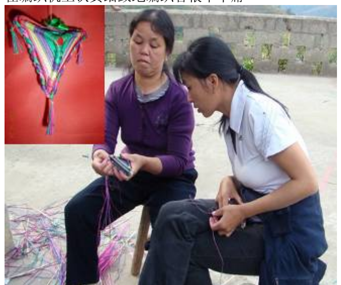
讨论如何编织精巧的小荷包