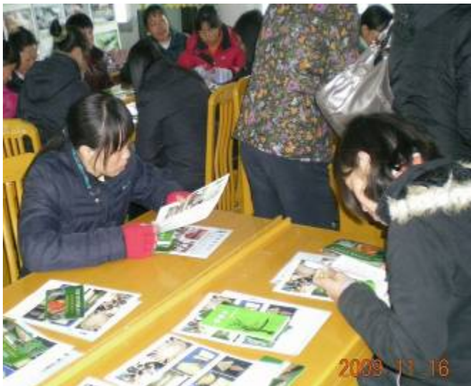
妇女学员聚精会神阅读香根草出版物