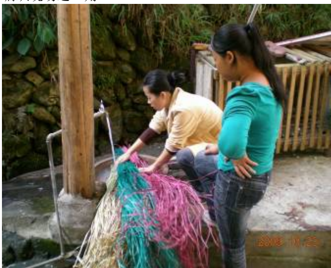
给染色过的香根草润水