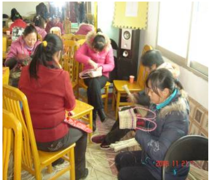
学员个个专心致志编织香根草小拎包