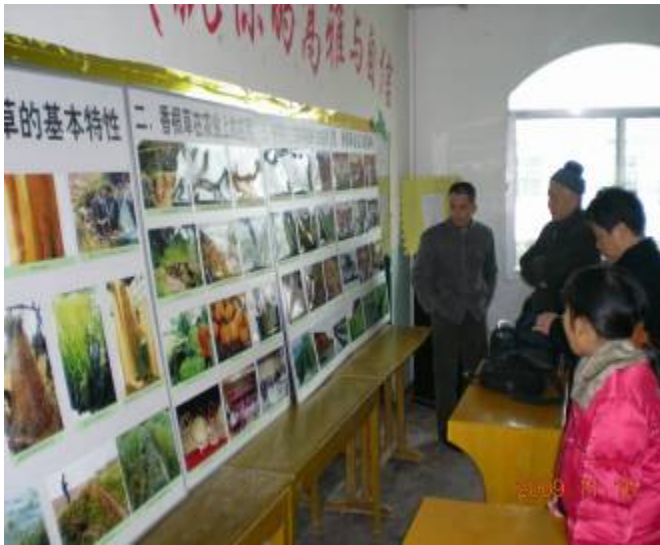
介绍香根草系统图片展览