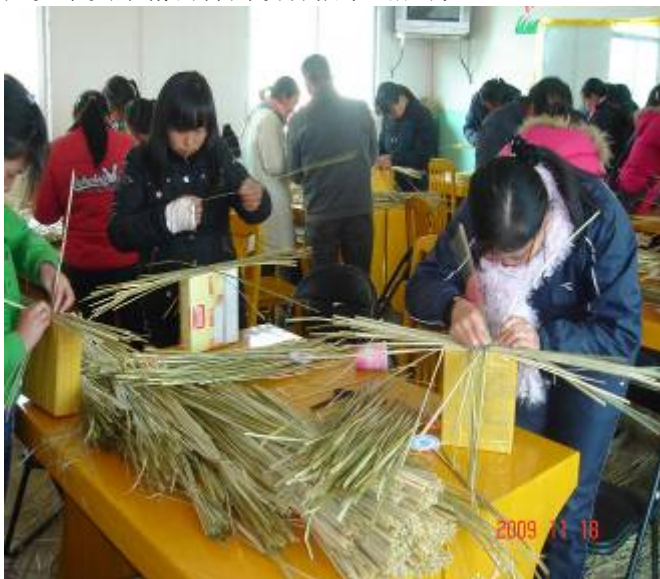
学员开始编织香根草物件