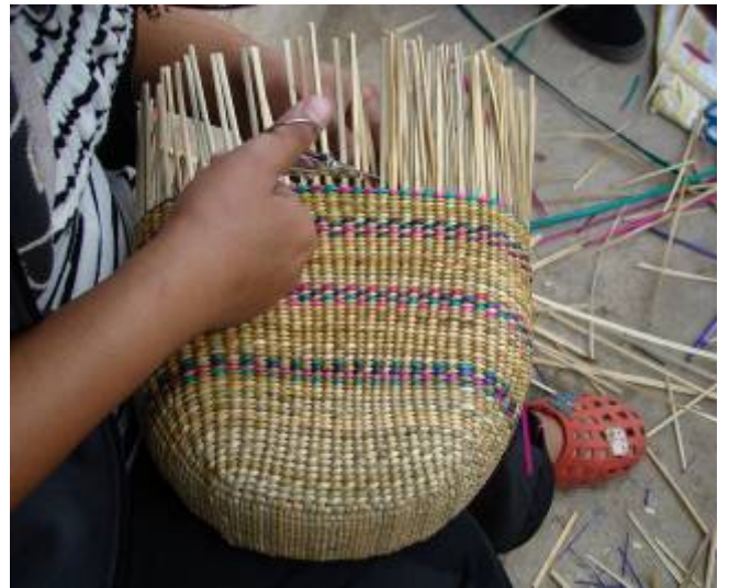
正在编织中的一个包