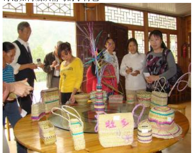
编织的香根草手工艺品集中展示评选