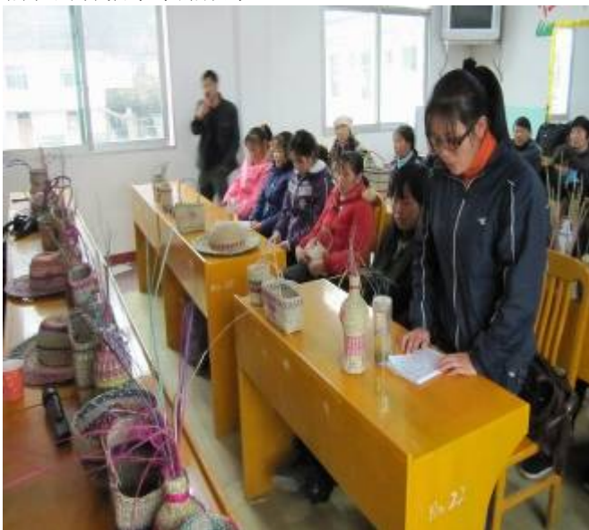
编织培训班学员代表在闭幕式上发言