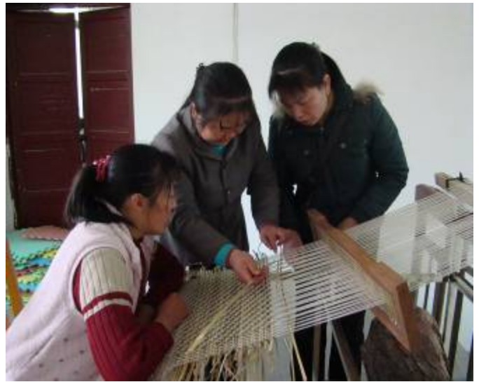
学员们学习编织香根草草席