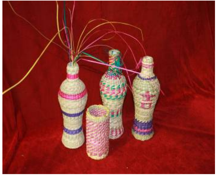
香根草编织的花瓶、笔筒