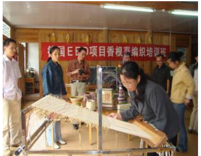
在编织机上认真细致地编织香根草草席