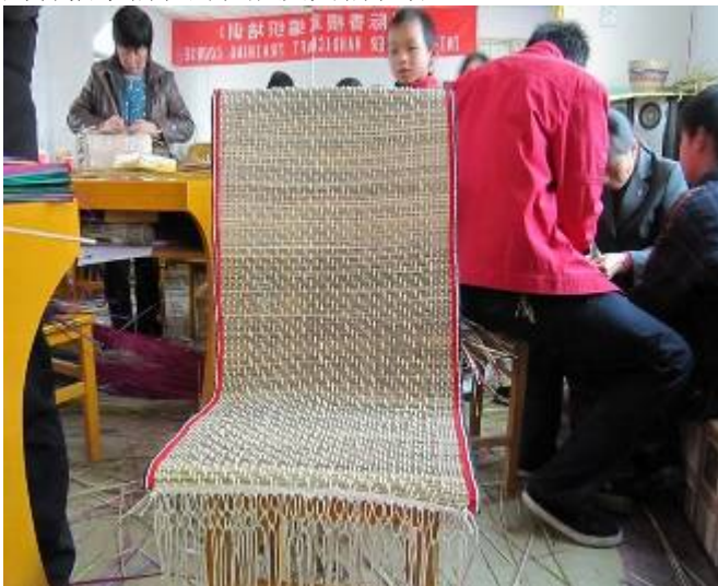
编织的香根草草蓆展示